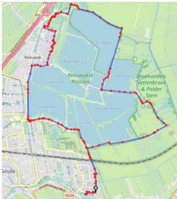
Route 21,1 km

Hebt u vragen, dan kunt u ons tot uiterlijk 9 november benaderen via info@halvemarathongouda.nl .