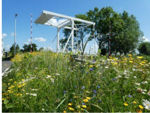
Bloeiende bermen voor biodiversiteit