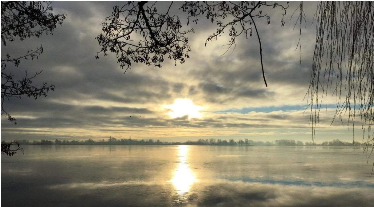
Zon op de Gravekoop