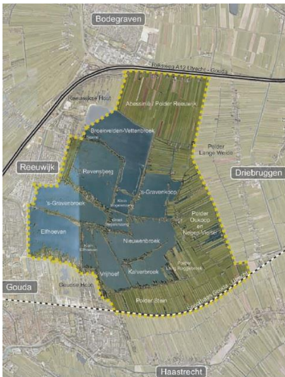
Sluipwijk & Plassengebied

Het dorpssteam is de stem van de bewoners bij het maken van beleid en keuzes voor het behoud van de huidige waarden en de nieuwe ontwikkelingen in het plassengebied.