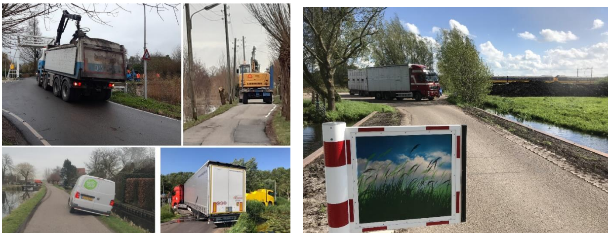
Samen zoeken naar oplossingen voor betere bescherming van de kwetsbare wegen en bermen en de weggebruikers.